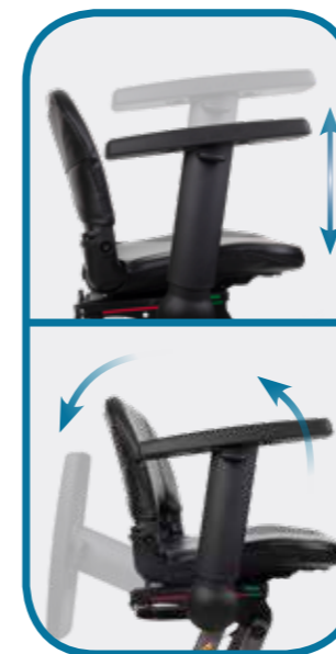
Reposabrazos de serie en el scooter Bali Confort