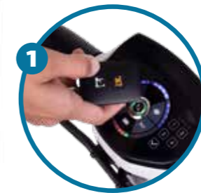
Panel de control táctil