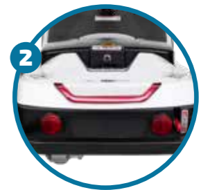
Luz led de freno