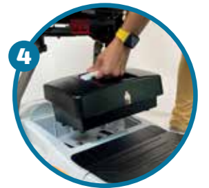
Batería de fácil extracción