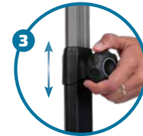
Regulador de altura del manillar